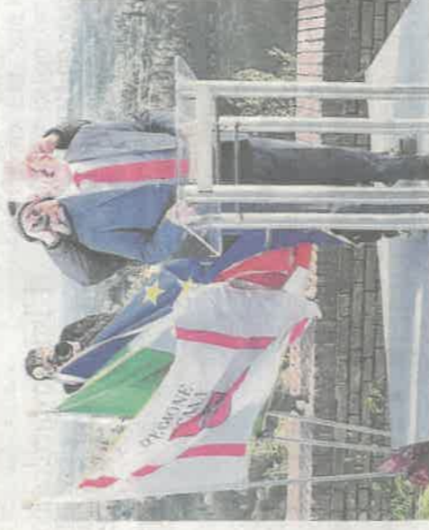
Eugenio Giani ieri a San Miniato