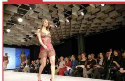
[Firenze] Tessile e biancheria di casa a Firenze: inaugurate le due fiere alla Fortezza da Basso